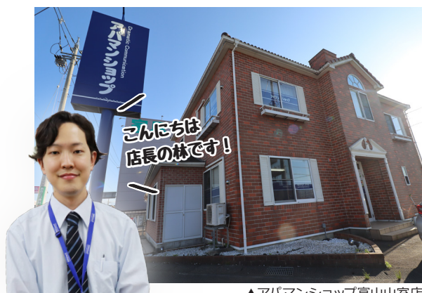
▲アパマンショップ富山山室店

店長歴としては通算まだ1年で、至らぬ点多いかと思いますが、管理大家さんの笑顔（えがお）のため、店舗スタッフや関係部署と力を合わせてまいります。今後ともよろしく願いいたします。