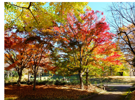
▲秋の大泉中央公園

この地域は特にファミリー層に人気があり、教育施設も充実しています。大泉学園は、アニメ制作会社「東映アニメーション」の本社があることから、アニメ文化と関連性が強いエリアでもあります。また、近隣には大泉中央公園や和光樹林公園といった自然豊かな場所があり、住民の憩いの場として親しまれています。住宅地としての静けさと利便性を兼ね備えた大泉学園は、緑豊かな環境を求める人々にとって、住みやすいエリアとなっています。