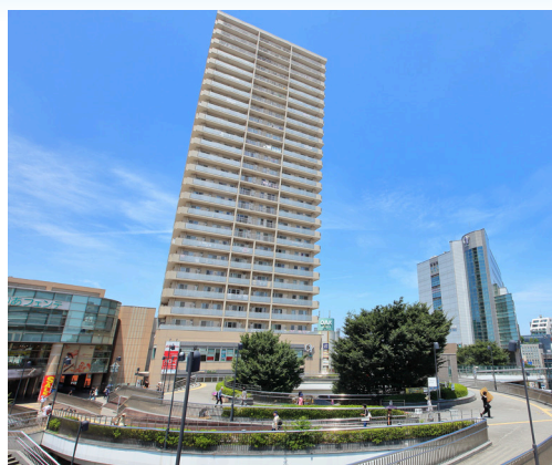
▲大泉学園駅 西武池袋線

大泉学園は、東京都練馬区に位置する住宅街で、静かな環境と緑豊かな公園が特徴のエリアです。西武池袋線の大泉学園駅が中心となり、池袋や都心へのアクセスが良く、通勤・通学に便利です。駅周辺にはショッピングセンターやレストラン、カフェがあり、日常生活に必要な施設が充実しています。